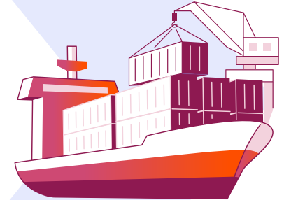
Nihai alıcılar (deniz taşımacılığında)